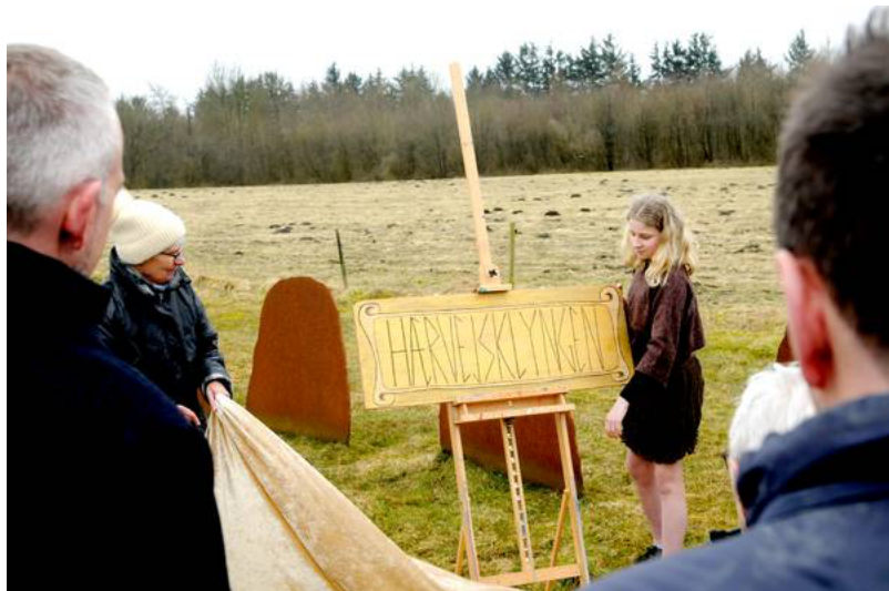
Landsbyklyngen har nu fået sit eget navn.

- I fremtiden vil her komme folk fra Frankrig, Holland, Tyskland, Finland, Norge og så videre hertil. De kommer nok ikke vandrende, men de kommer. Nu hedder de bare turister. Vi skal tage imod dem og fortælle den utrolig spændende historie om det område de er kommet til, måske det mest spændende i Danmark overhovedet, området i og omkring vores nye landsbyklynge.